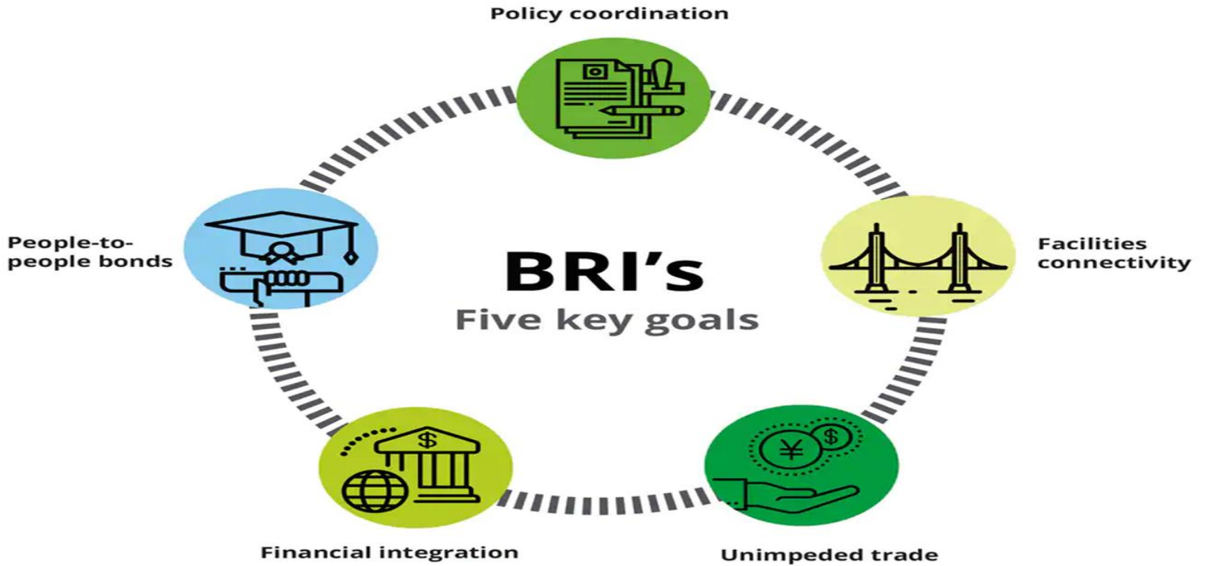
Figure 1. BRI's five key goals